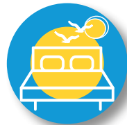
LITS DE VACANCES URLAUBSBETTEN