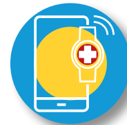
ROUDE KNAPP TÉLÉALARME • TELEALARM PROCHAINEMENT DISPONIBLE • DEMNÄCHST VERFÜGBAR