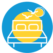
LITS DE VACANCES URLAUBSBETTEN