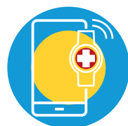
ROUDE KNAPP TÉLÉALARME • TELEALARM PROCHAINEMENT DISPONIBLE • DEMNÄCHST VERFÜGBAR